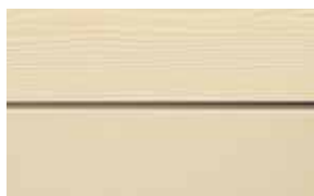
C02 Beige RAL: 1015 – NCS S 1010-Y 20 R