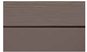
C55 Mullvadsbrun RAL: 7006 – NCS S 6005-Y 50 R