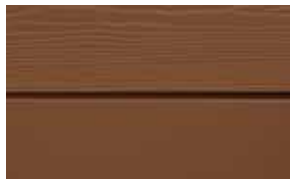
C30 Brun RAL: 8007 – NCS S 6020-Y 40 R