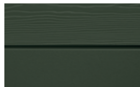
C31 Grön RAL: 6009 – NCS S 8010-G 10 Y

Ljus Ek och Mörk Ek tillverkas endast i Cedral Lap Wood. Etersilan kantimpregnering ska appliceras på Ljus/mörk ek då dessa har en laserad yta.