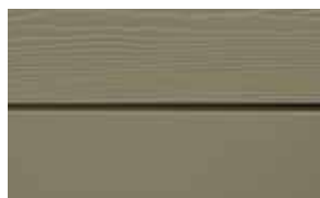
C58 Valnöt RAL: 7002-NCS /