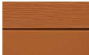
C32 Orange RAL: 8023 – NCS S 3060-Y 50 R