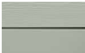
C06 Oliv RAL: / – NCS S 3005-G 20 Y