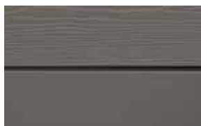
C53 Bly RAL: 7039 – NCS S 6502-Y