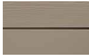
C14 Atlasbrun RAL: / – NCS S 4005-Y 50 R