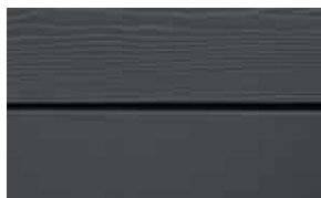
C19 Antrazit RAL: 7016-NCS /