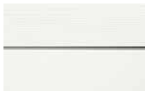
C01 Vit RAL: 9003 – NCS S 0500-N