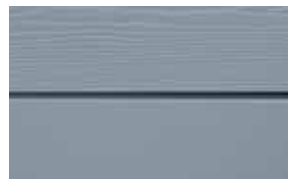
C62 Ocean blå / – NCS S 4010-R 90 BRAL: / – NCS S