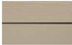
C03 Sand RAL: 1019 – NCS S 3005-Y 20 R