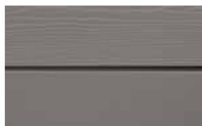
C56 Platina RAL: / – NCS S 5502-Y