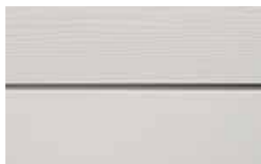
C51 Silver RAL: 7047 – NCS S 1500-N