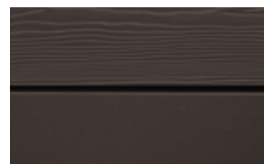
C04 Svartbrun RAL: 8019 – NCS S 8005-Y 80 R