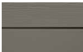
C59 Terrakotta RAL: / – NCS S 6005-G 80Y