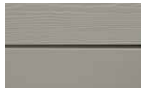
C52 Pärlemor RAL: 7030 – NCS S 4502-Y