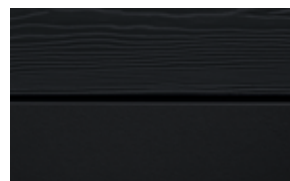
C50 Svart RAL: 9011 – NCS S 9000-N