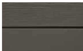
C60 Mörk Terrakotta RAL: / – NCS S 7502-Y