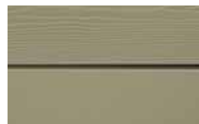
C57 Mandel RAL: / – NCS S 4010-G 90Y