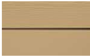
C11 Beigegul RAL: 1001 – NCS S 3020-Y 20 R