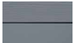
C15 Granit 6005-R 80 B