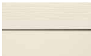
C07 Antikvit RAL: 9001 – NCS S 1005-Y 10 R