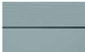
C10 Gråblå RAL: 7010 – NCS S 3010-B 10 GRAL: