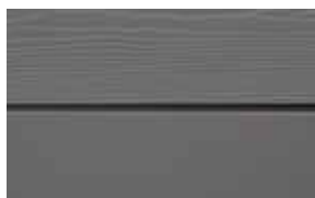
C54 Petroleum RAL: 7037 – NCS S 6500-N