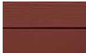
C61 Faluröd RAL: / – NCS S 5040-Y 80 R