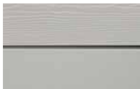
C05 Grå RAL: 7047 – NCS S 3000-N